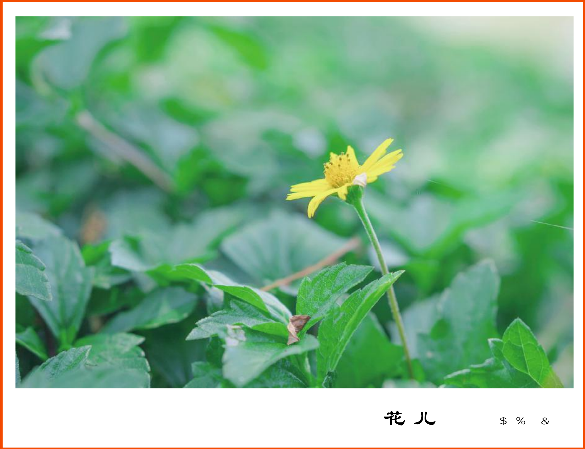
花儿 $ % &

" " , ? , - , / , O , 123 ? , h . 4 567 , 67 ? 8. 98 , : ; ; < = ; N , S , S , > ? . - @ , AB , CDEF . GH " H " " . , , JK L . , H H ~ , < = H , ; , / , M N ? , OP . QR S , T c , ^ , ? , & UV W XYZ [ \ , 2 ; , c . 6 " 12 , & L L ] 7 , H , ^ _ . M a , n n , ! : b T ^ . c de , ; ; . f N , g h i j k , l m , ^ , a ..... , # $ % , & ' ! " n , de o , ppqr st ( ) . ! " , * + , , Xvwxyz { | } , hN N -